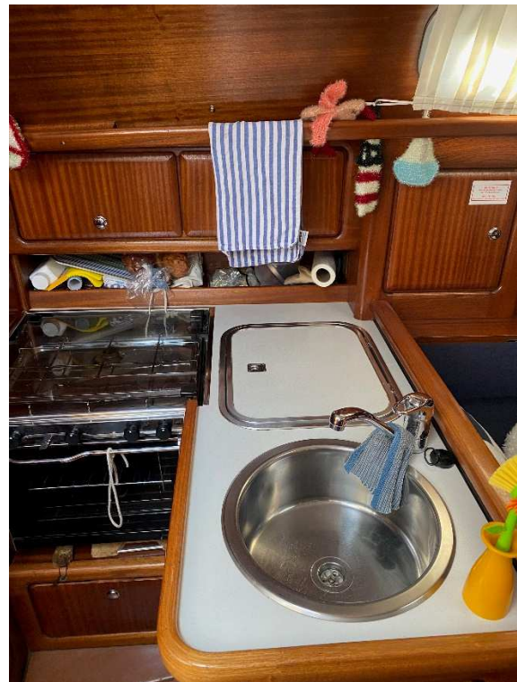
Pantry mit Gasherd/-backofen, Spüle und Kühlschrank