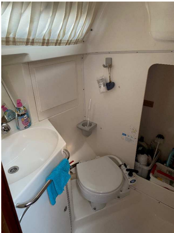
Naßzelle mit WC & Waschbecken