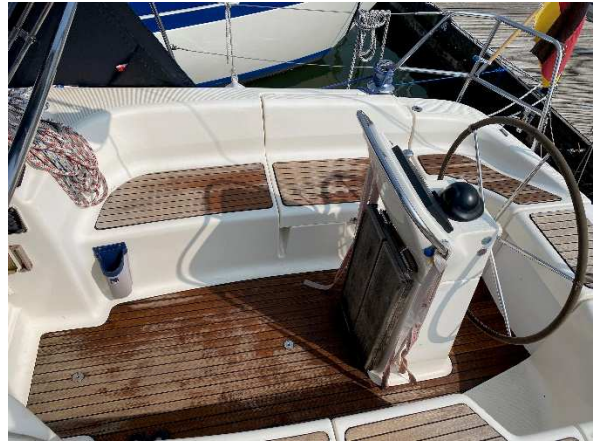
Cockpit mit Tisch zugeklappt