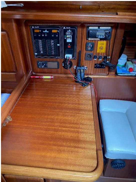
Navi-Ecke mit Sicherungskasten