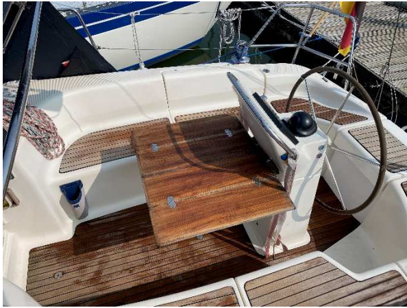
Cockpit mit offenem Tisch