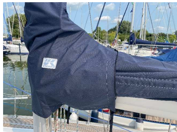
Persenning Großsegel (neu in 2022)