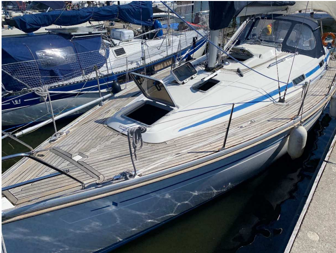
Gesamtansicht von Bb