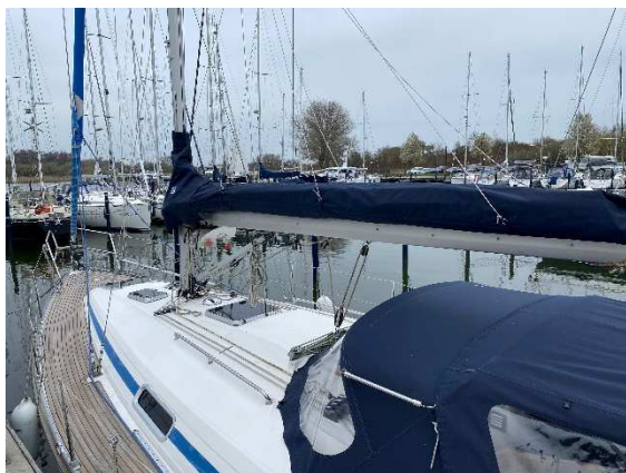
Lazy Bags (neu in 2022)