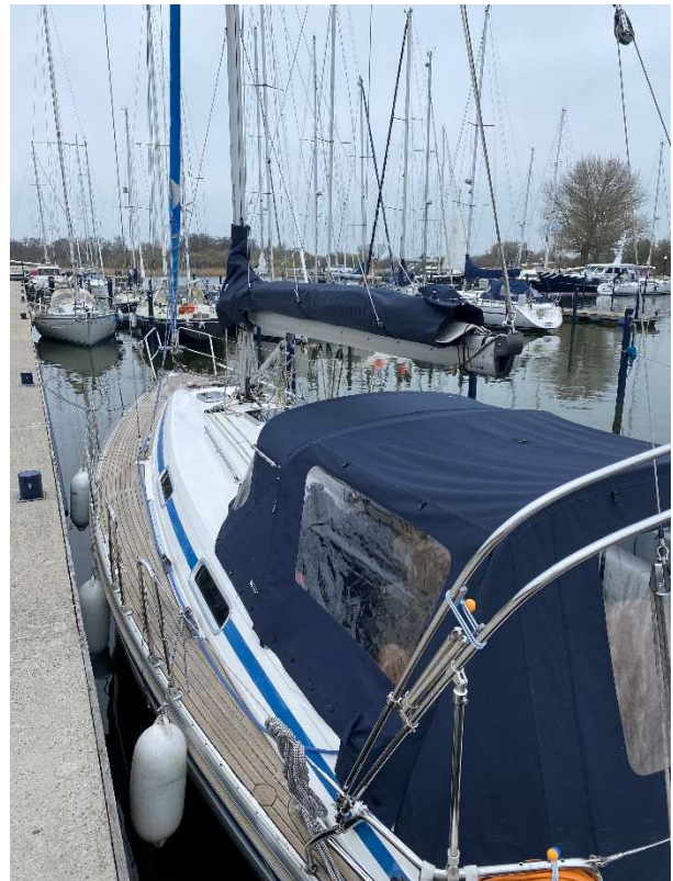
Kuchenbude (neu in 2022)