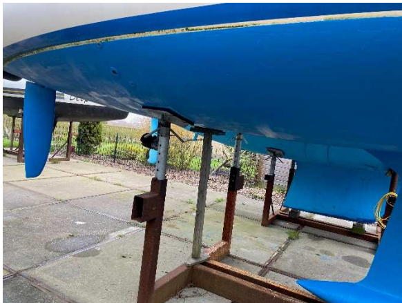
Heck m. Antifouling (neu in 2024)