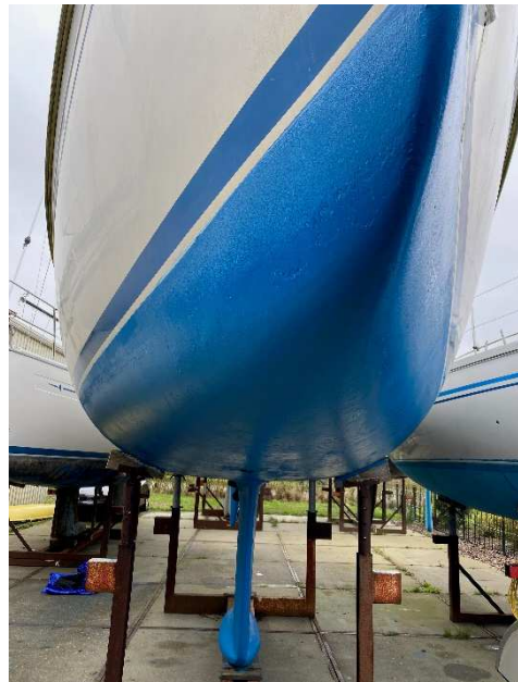
Bug mit Antifouling (neu in 2024)